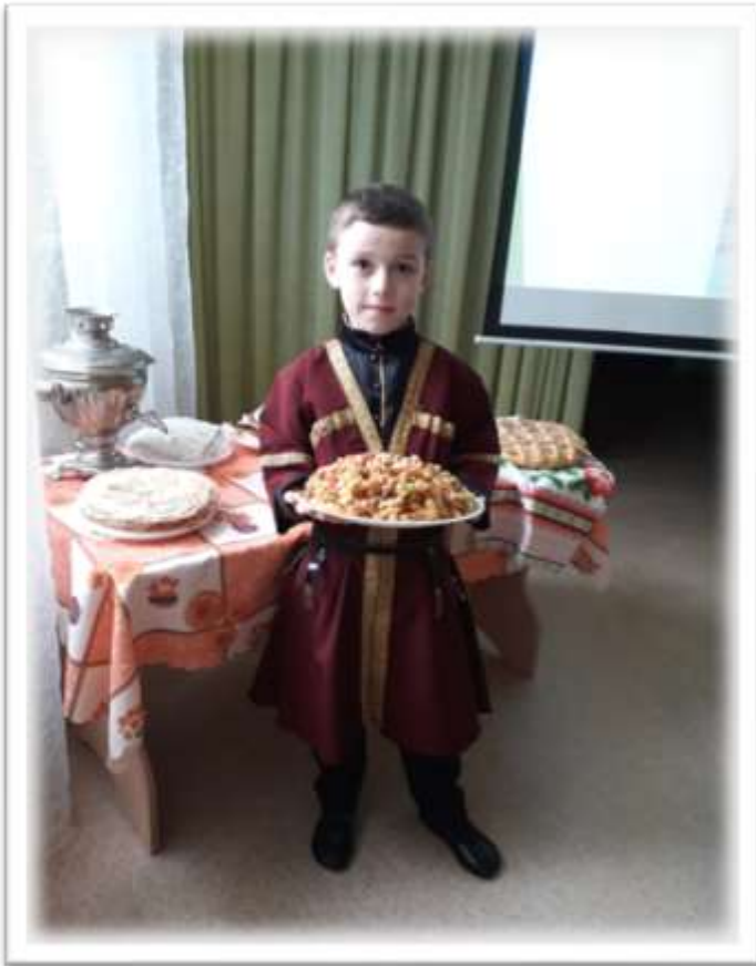
Лезгин. Десерт «Чак-чак»