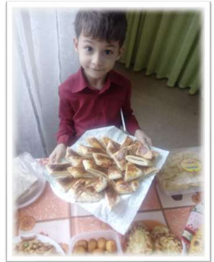
Арменин. Печенье «Гата»