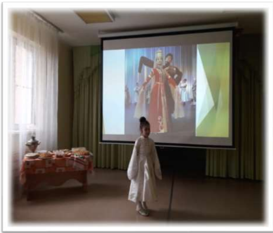
Абазинка. Пончики «Баурсак»