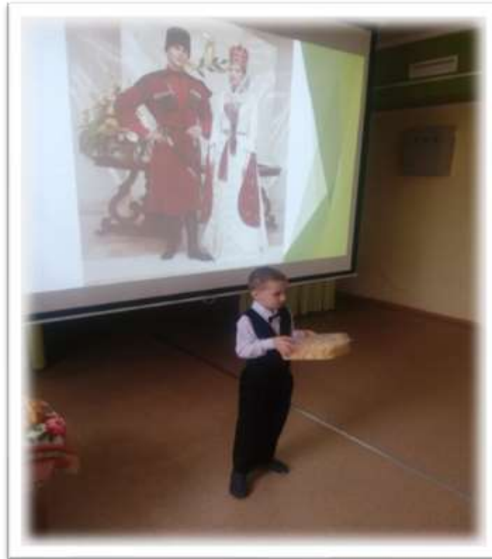
Татарин. Сладкое лакомство «Хворост»