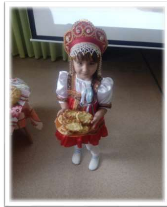
Русские. «Блины и пирожки»