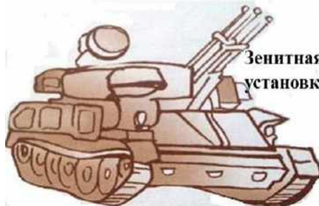
Зенитная самоходная установка