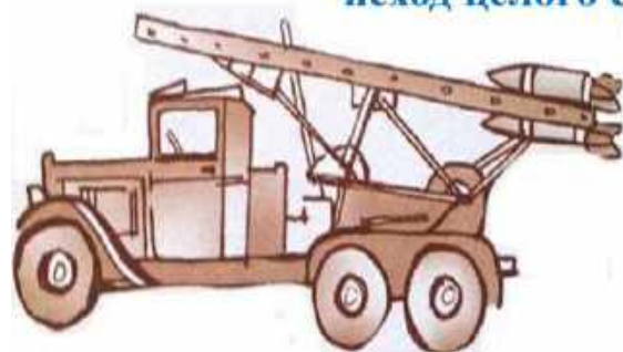
Установка реактивной артиллерии «Катюша»

Во время войны не раз бывало, что одно меткое артиллерийское попадание решало исход целого сражения