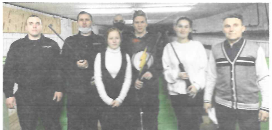
Товарищеская встреча по стрельбе между отделом полиции и педколледжем